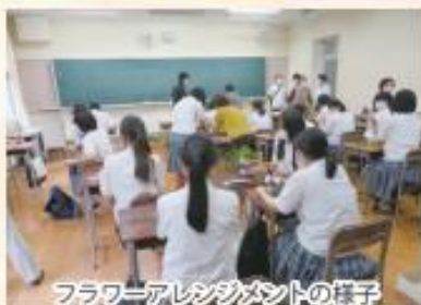
フラワーアレンジメントの様子

A 市内の高等学校と連携し、フラワーアレンジメントを通じた、生徒と老人クラブ会員の世代間交流を年6回程履行しています。花植えを行うボランティア団体の花守隊から花をもらって活動しています。