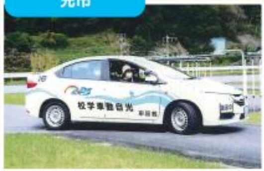
高齢者ドライビングコンテスト