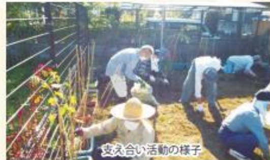
支え合い活動の様子