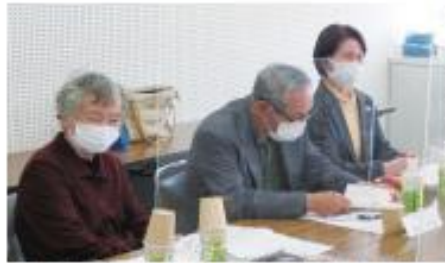
会議の様子。活発な意見交換が行われました。

令和3年度中に各市町老連からいただいた意見を集約し、市町老人クラブ連合会代表者連絡会議にて結果を共有する予定です。