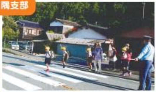
交通整理のお手伝い