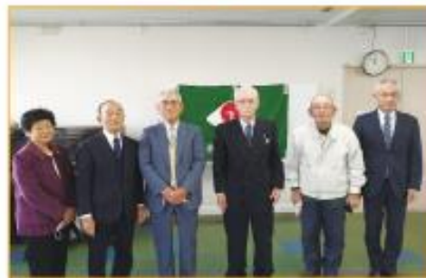
会議終了後は一時的にマスクを外して記念撮影をしました