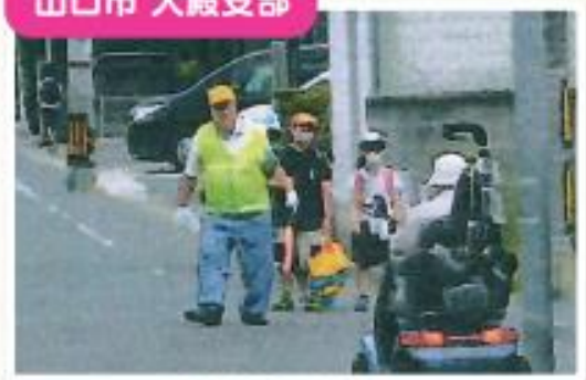
交通安全の呼びかけ