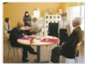
カフェを通して生徒と交流を楽しみます

こでは、就業体験として、カフェ（名称：はぐくみカフェ）が開かれ、生徒は自立に向けて準備を重ねます。そこに老人クラブ会員がお客様として訪問し、生徒と会員の交流が行われました。 【今後の活動の展望（今後の活動予定や懸念込みなど）】