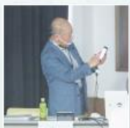
講師 NPO法人 シニアネット光の方々

令和元年度に県が実施した「シニアの社会参加等に関する県民意識調査」に基づき、SNS等の情報発信技術を活用し、地域の情報、活動の情報を入手したり発信したり、またSNS等でつながることでコミュニケーションを深めたり新たな仲間づくりを進めたりと実際のツールを活用した技術を実際に活用されている同年代の方々から学びました。