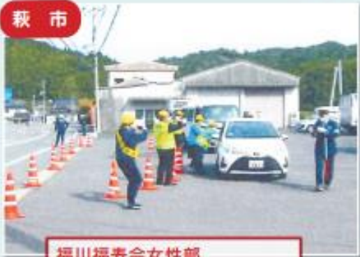
福川福寿会女性部 安全運転お願いのあめ玉配り