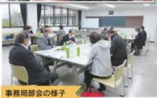
事務局部会の様子