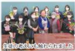
生徒の考えにも触れられました。

学校は、皆さんが想像している以上に門戸を広げています。こちらから「何かお手伝いすることはないですか?」と活動の新たな一歩を踏み出してほしいと思います。