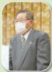
平田会長あいさつ