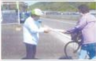
東和支部 交通安全呼びかけのチラシ配り 周防大島町