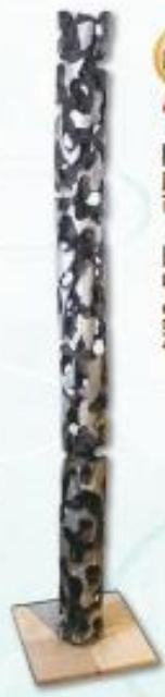
『希望の柱』 防府市 田中 繁満