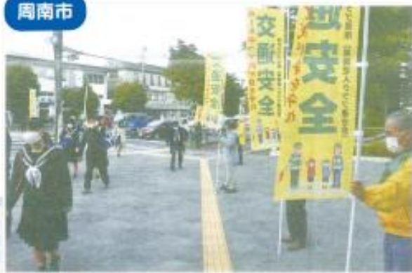
見守り委員会 市役所前での交通安全呼びかけ