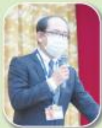
岡村事務局長報告