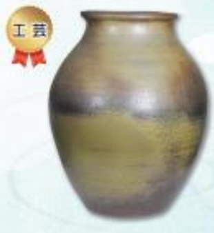
『つぼ』 山陽小野田市 国広 光保