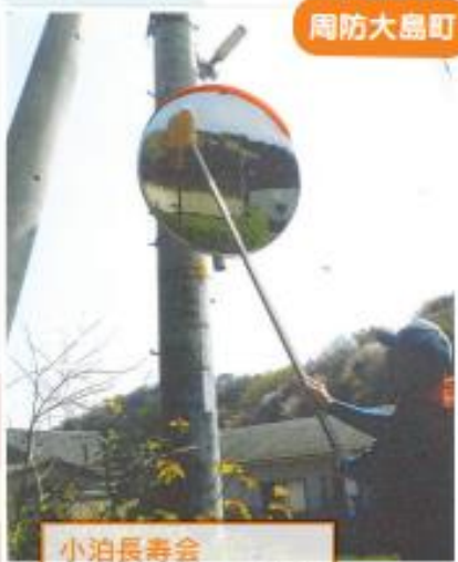
小泊長寿会 カーブミラーの清掃