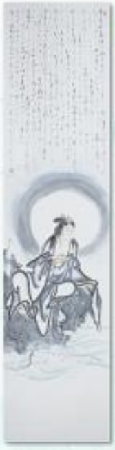
『かな般若心経(十絃)』 下松市 藤原重夫