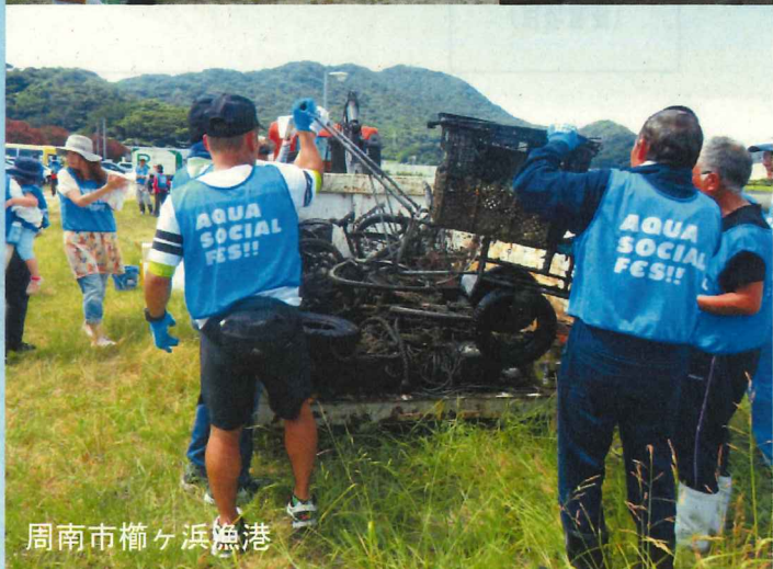
周南市榑ヶ浜漁港