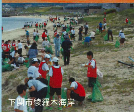
下関市綾羅木海岸