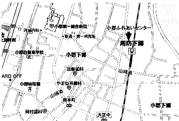
小郡ふれあいセンター