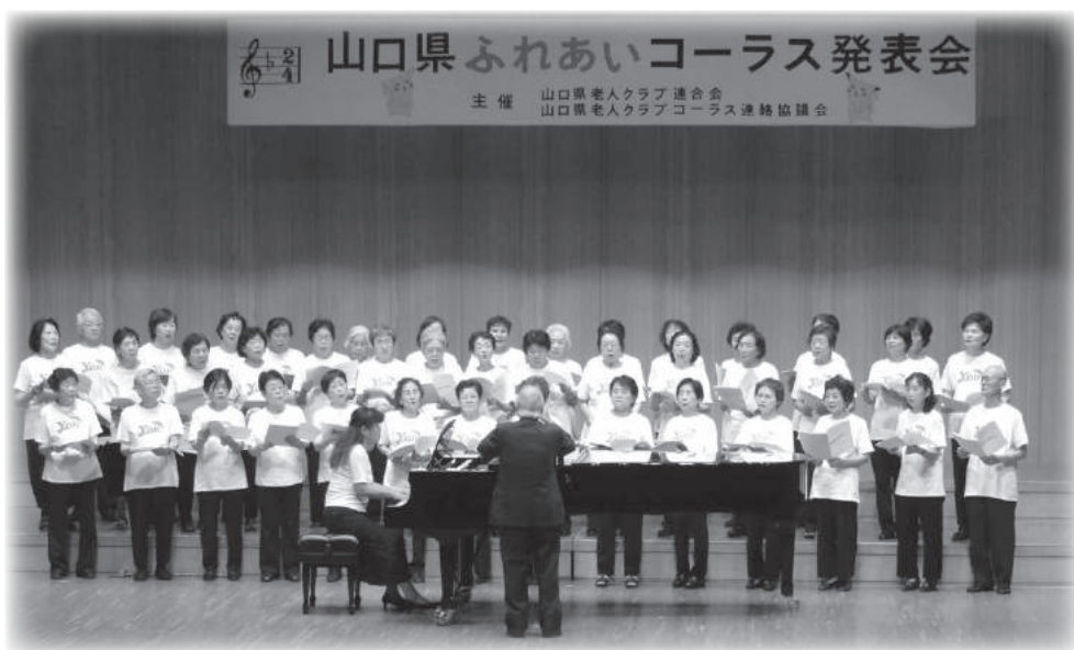
【写真】平成29年8月23日(水) 山口県ふれあいコーラス発表会