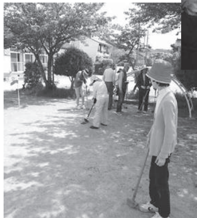
グラウンドゴルフ練習中