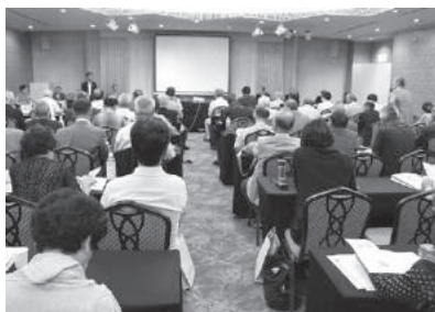
第3分科会 がんばる！若手委員会