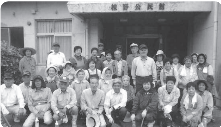
社会奉仕の日 椋野公民館の剪定と除草