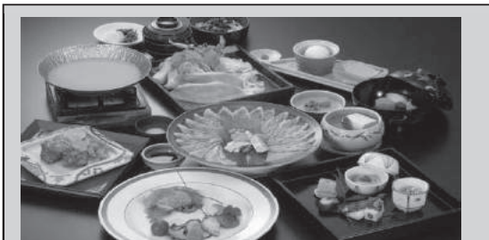
写真は かんぽの宿湯田の「ふく料理と料理長こだわり会席プラン」