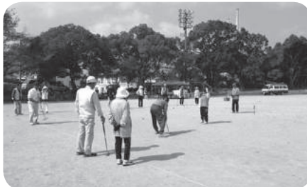
ゲートボール大会

年々会員が減少しているという現状は、美祢市老連をはじめ各单位役員も危機感を持っていますが、実質会員数をプラスにもっていきつとがなかなかできず、頭を悩ませています。