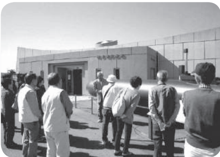
一日研修旅行 平生町の人間魚雷 「回天」の見学 (13単位クラブ)