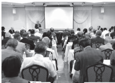
第2分科会 担おう！地域づくりを