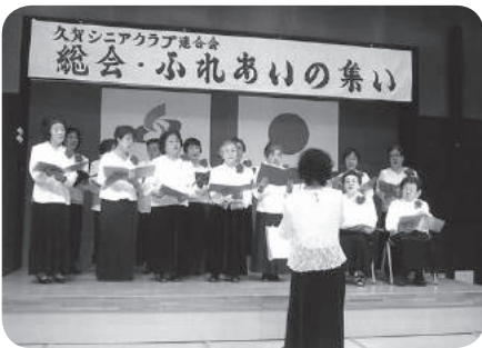
童謡を歌う会の合唱

どんど焼き大会には全面的に協力し、男性は会場の設営、女性は「ぜんざい」や「七草がゆ」の接待をしています。