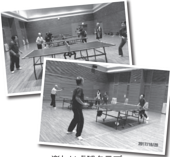
楽しい卓球クラブ

A 毎週木曜日の午前10時から12時のレッスンには、会員の90%の参加がありました。卓球を通して、老人クラブの活動の良さを紹介したことも、会員増強に繋がりました。