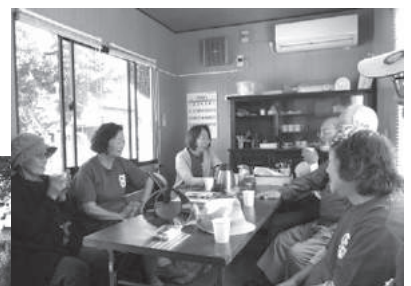
おしゃべりタイム

これからは、メンバーの固定化を避けるために、会員、非会員に関わらず「ちよつと寄っていきませんか」「コーヒーを飲んでいきませんか」等の声かけをして門戸を広くつこうと思っています。