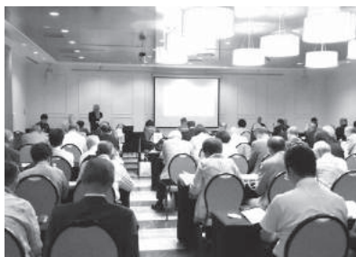
第1分科会 のばそう！健康寿命