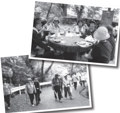
桑山ごみ拾いウォーキング

A 老人クラブがない地区に、新しく老人クラブが出来、年々会員の増強を果たしてきています。平成27年度の活動賞受賞をはずみに会員が増え、今年度より第2クラブを発足し、より充実した活動を展開することが出来るようになりました。