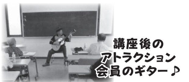
講座後の アトラクション 会員のギター♪