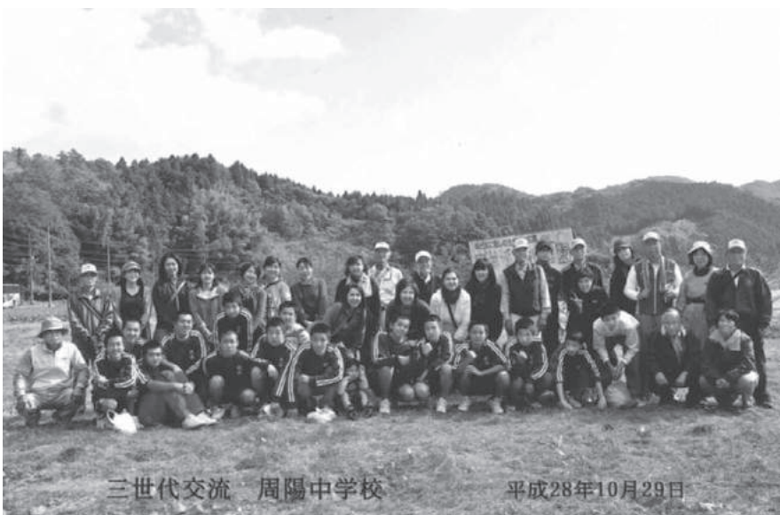
三世代交流 周陽中学校

※「自学サポート」…期末テスト前の放課後に、徳山大、徳山高専の学生を交えて自習の手伝いをします。