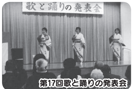
第17回歌と踊りの発表会

○ 町の環境美化への協力として平成21年に「道路里親制度」をスタートし「町歩道」のゴミ拾いを週1回実施、町の花壇の管理も協力しています。