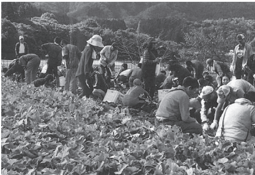
三世代交流会（芋ほり）の様子

徳山小学校では、子供たちを地域の担い手としての成長をめざし、子供たちが多くの信頼できる大人と出会い、地域を愛し、地域に誇りが持てるよう、地域参画型授業※や大人の学び※等を通して、地域住民、PTAの来校者を増やす取組を積極的に進めています。平成28年度は、約12,000人（平成29年2月時点）が来校しています。