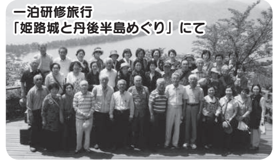
一泊研修旅行「姫路城と丹後半島めぐり」にて

和木町老人クラブの一番の問題は、会員が年々減少してきていることです。入会者が少なく平成25年に「会員増強推進委員会」を立ちあげ、該当者へ入会を勧めておりますが入会にはいたっていません。このままでは「老人クラブの解散」という事にならないように若手会員の勧誘を続けていきたいと思えます。 終わりに、和木町老連は会員の健康を考え「健康づくり」を第一に活動していきたいと思えます。