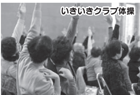
いきいきクラブ体操