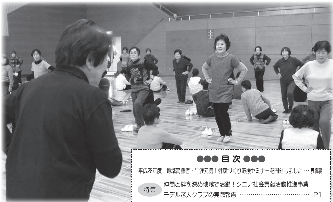
【写真】平成28年度地域高齢者・生涯元気！健康づくり応援セミナーの様子