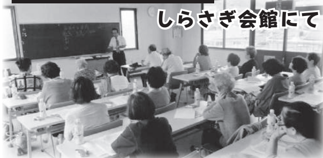
しらさぎ会館にて