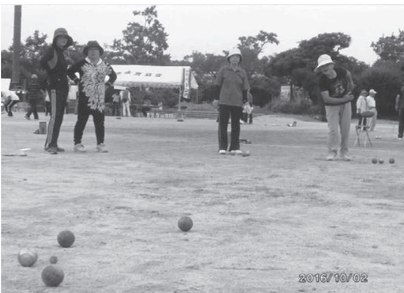
ペタンクの練習風景

励みになることで、また次の活動参加につながっています。地域で井戸端会議のような自然な集まりが少なくなる中で、高齢者の閉じこもりを防ぐ機会として、学校との連携は大変重要と感じ、活動を続けています。