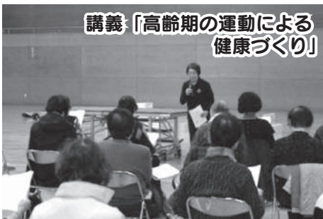
講義「高年齢期の運動による健康づくり」