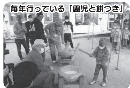
毎年行っている「園児と餅つき」